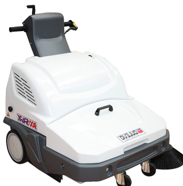
Dulevo 900 Spark

Maskinen finns i följande två versioner: