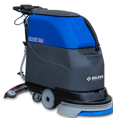
Dulevo BOOST 50.0